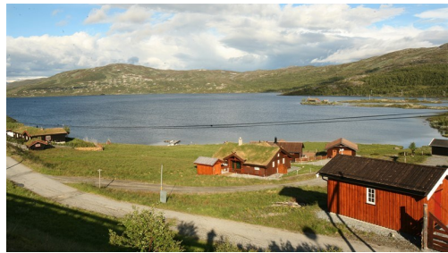
Hütten in Nystuen.