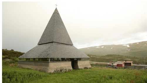
Kirche St. Thomas auf Kyrkjestolen.