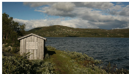
Entlang des Otrevatn.