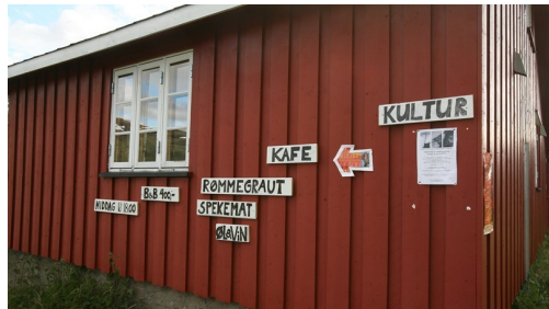
Sie erhalten traditionelles norwegisches Essen (steht auf den Schildern) auf Kyrkjestolen.